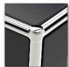
Verbindungsknoten mit Klicksystem

Durch das zum Patent angemeldete Klicksystem ist dieses Möbelstück immer wieder veränder- & erweiterbar.