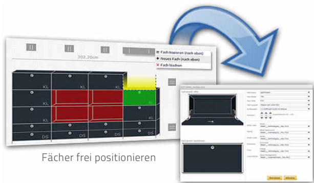
Fächer frei positionieren

Werden Sie zum Möbeldesigner und erstellen Sie mit unserem neuen system8X Konfigurator Lowboards, Sideboards & Highboards ganz nach Ihren Anforderungen und Bedürfnissen. Mit nur wenigen Klicks gestalten Sie sich Ihr individuelles Möbelstück in zeitlosem Design.